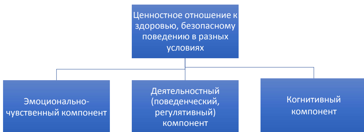
Рисунок 14. Модель структурных компонентов категории «ценностное отношение к здоровью, безопасному поведению в разных условиях»

Ребенок принимает правила и нормы безопасного поведения и начинает понимать их культурно-смысловой контекст (почему, зачем, для чего) и осмысленно следует им в своей жизни.